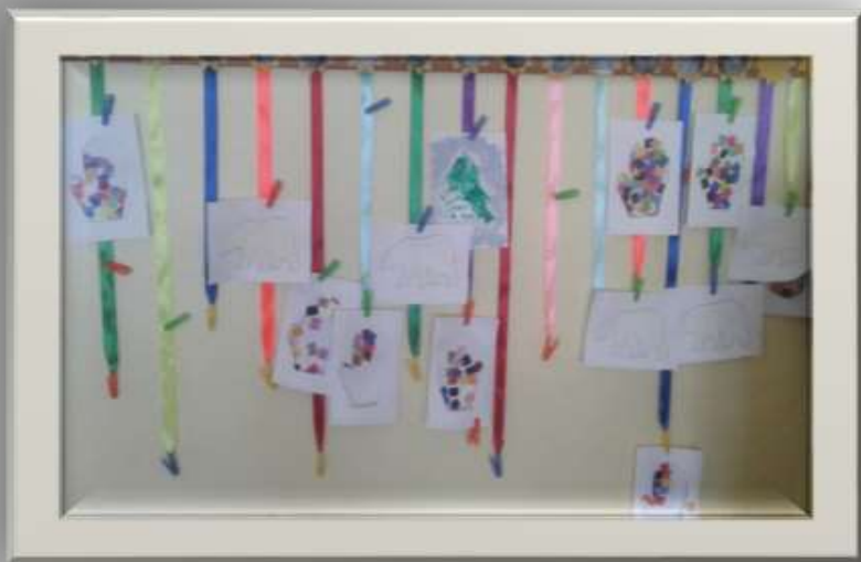
выставка детских рисунков , персональная выставка

В дошкольном возрасте дети особенно чувствительны к оценке взрослого. Они ожидают поддержки и похвалы, хотят увидеть и услышать одобрение своих действий. Поэтому каждый ребенок может увидеть свою работу на выставке, которая расположена в раздевалке.