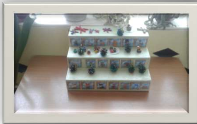
лестница « Волшебные ручки»