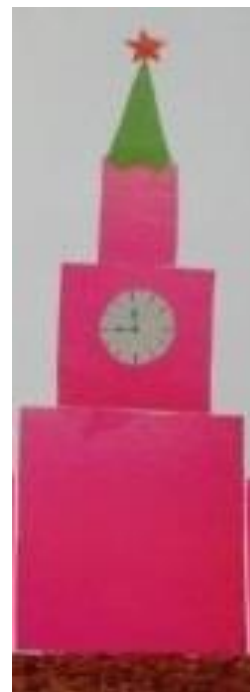
Рисунок 2 «БАШНЯ» аппликация