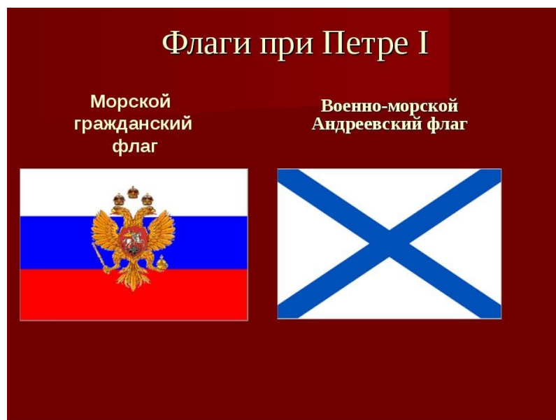
Значение символики при Петре I

Законодателем же, который утвердил стяг из трёх полос, как государственный символ, стал Петр I. По его Указу в 1705 г., над каждым кораблём должен был взвиваться стяг из трёх полос. Государь лично изобразил расположение и соотношение бело-сине-красных полос на полотнище.